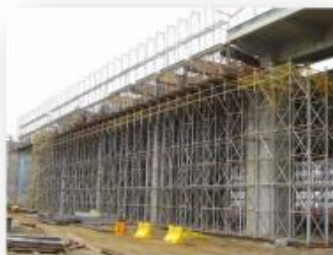
Scaffolding with Inspection

We have expertise and Our years of experience in the construction industry enables us to quickly solve day to day problems as they arise on site with ease and our proactive approach