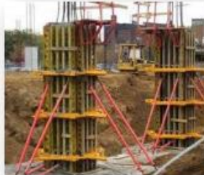
Formwork with Inspection